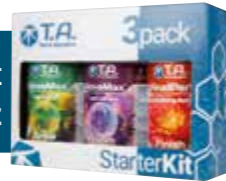
NovaMax Starter Kit

NovaMax® Grow a NovaMax® Bloom kombinují sílu suchých koncentrátů se snadnou aplikací kapalných přípravků. Jedná se o kompletní a účinné hnojivo, díky čemuž nepotřebujete k podpoře růstu vašich rostlin Cal/Mag ani žádná aditiva!