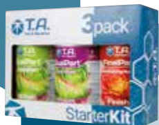
DualPart Starter Kit