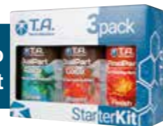
DualPart Coco Starter Kit

Dostupné v: 0,5L • 1L • 5L • 10L • 60L • 1000L